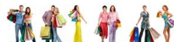
L'évolution des modes de vie

acheteur paradoxal connaisseur raffiné impulsif/ve malin nostalgique économe opportuniste stratégique responsable traditionnel(le) ultra économe zappeur